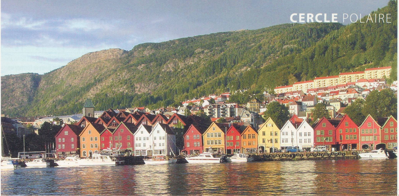
C'est ici, dans la charmante ville de Bergen, que débutent ou s'achèvent les croisières de la compagnie Hurtigruten .

14 degrés au cœur de l'été. On peut se déplacer en voiture à travers les Lofoten, mais les autochtones préfèrent les bateaux pour accéder aux habitations disséminées le long du littoral.