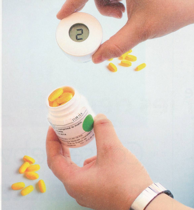
A chaque ouverture, le pilulier électronique affiche la prise et surtout l'enregistre sur la durée, ce qui permet ensuite d'examiner le suivi du traitement.

tion est une simple boîte comprenant un couvercle avec affichage digital. On y range les comprimés et à chaque ouverture, il affiche le bilan quotidien. A priori, cette invention made in USA , reprise depuis plus d'une quinzaine d'années par une société valaisanne, ne semble pas aussi révolutionnaire que cela. Elle n'évite pas à elle seule les oublis, volontaires ou pas. Alors, simple gadget?