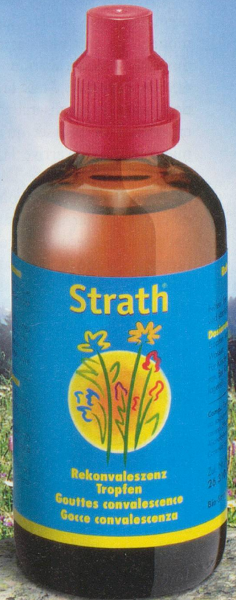
Teneur en alcool: 32% vol.