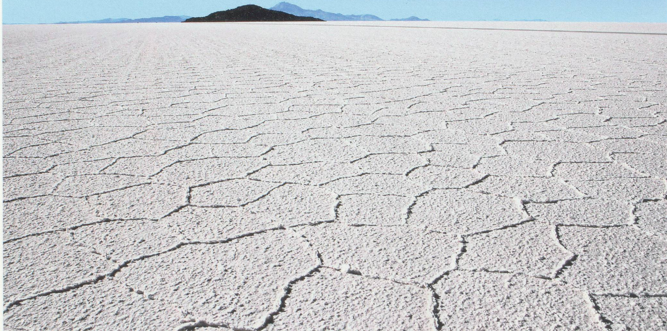
Le Salar d'Uyuni est une banquise de sel craquelée de 12 000 km 2 , dont la couche oscille entre 30 centimètres et 12 mètres d'épaisseur.

nous sommes amenés à rêver, bercés par les rayons du soleil qui masquent le fond de l'air froid et sec. Non loin, cette terre de contrastes nous offre un visage très différent. Les geysers, dans une odeur pestilentielle de soufre, semblent vouloir murmurer à nos oreilles les maux de toute une planète.