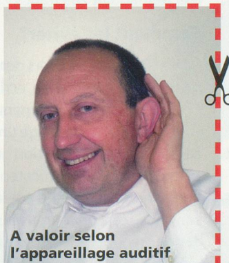
A valoir selon l'appareillage auditif