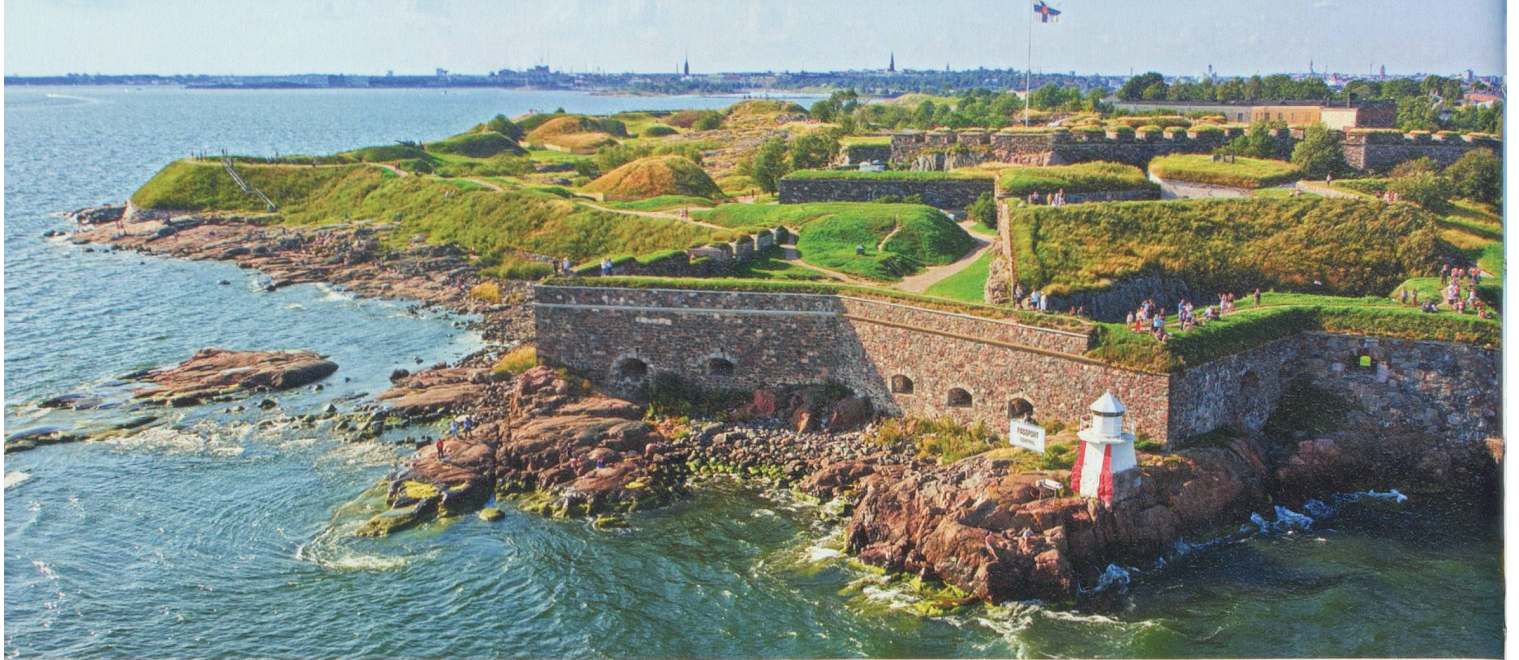
L'archipel d'Helsinki ne compte pas moins de 330 îles, offrant une occasion magnifique de s'évader du stress de la vie quotidienne.