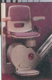
Lifts à siège