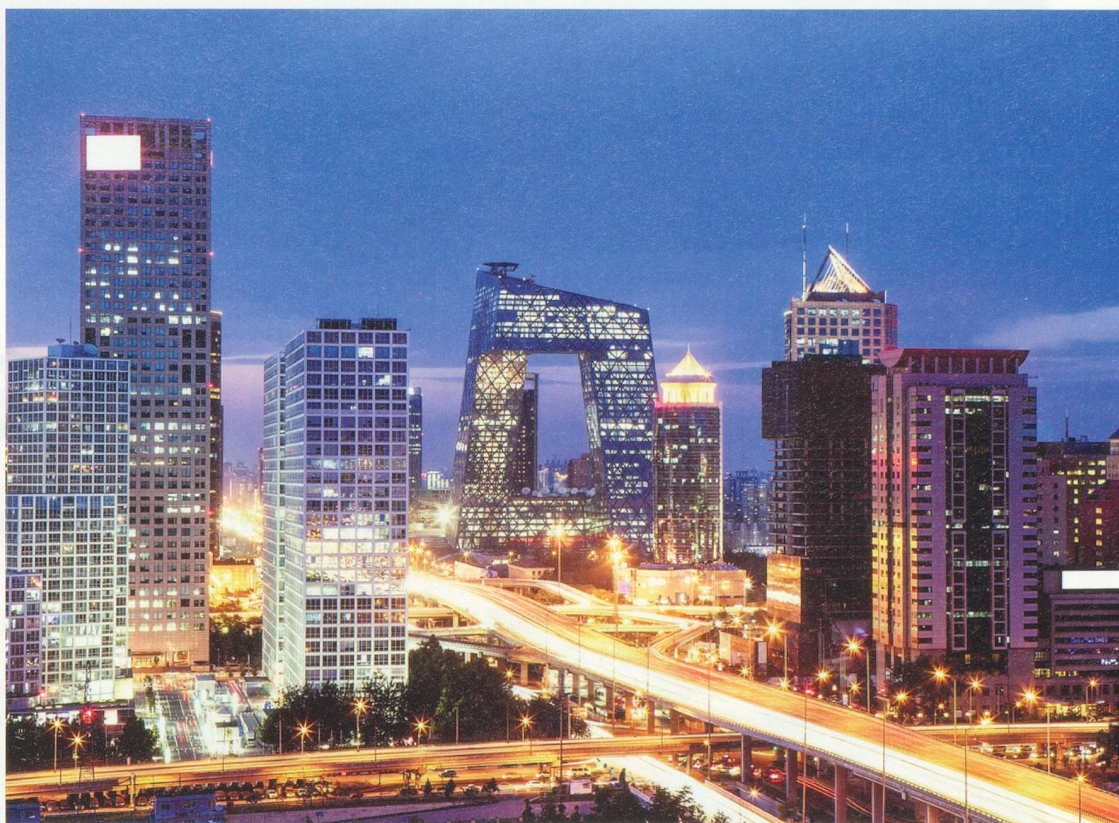
Le siège de la télévision centrale chinoise China Central Television (au centre), est un ensemble d'immeubles situé dans le nouveau quartier d'affaires de l'est de Pékin. Son bâtiment principal, le plus spectaculaire, atteint 234 mètres.