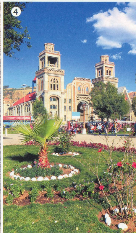
❶ Le Pérou compte pas moins de 35 espèces naturelles de maïs. ❷ Les derniers Indiens aymaras de Puno occupent les îles flottantes du lac Titicaca. ❸ Réalisés entre 400 et 650 av. J.-C. dans le désert, les géoglyphes de Nazca sont de grandes figures tracées sur le sol, parfois longues de plusieurs kilomètres. ❹ Reconstituée après le séisme meurtrier de 1970, Huaraz est le point de départ de nombreuses excursions, telles que les bains thermaux de Monterrey et Chancos. ❺ Une femme quechua, assise devant la Chapelle Sixtine d'Andahuaylillas. ❻ La vallée de Colca et ses cultures en terrasses.