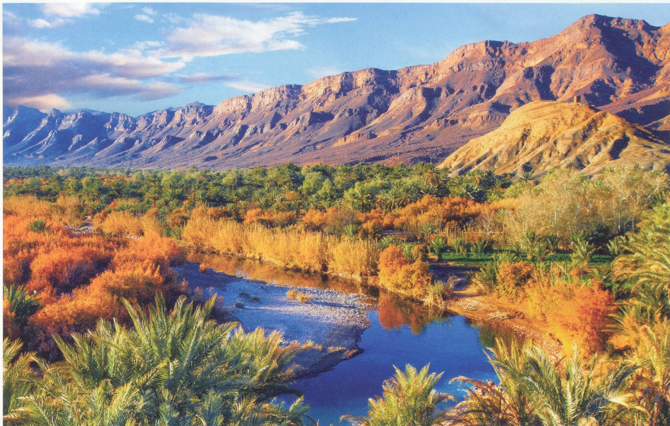
Une des innombrables oasis du Maroc, rafraichissante à souhait avec sa végétation qui se reflète dans les eaux de la rivière.

culturelle unique. Voyage enchanteur dans des médinas au charme incontestable.