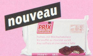
nouveau Galettes de riz enrobées de chocolat au lait Prix Garantie, 250 g (100 g = -.98) 1.95