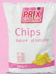
Chips nature Prix Garantie, 350 g (100 g = 1.05) 3.70