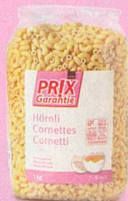
Cornettes Prix Garantie, 1 kg (100 g = -.17) 1.70