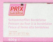
Poisson au four à la bordelaise Prix Garantie, 400 g (100 g = -.70) 2.80