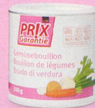
Bouillon de légumes Prix Garantie, 500 g (100 g = -.79) 3.95