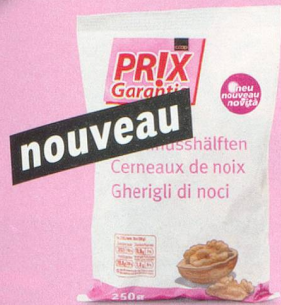
nouveau Cerneaux de noix Prix Garantie, 250 g (100 g = 1.68) 4.20

Déjà plus de 400 produits «prix bas garanti»!