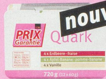
nouveau Préparation à base de séré fraise/pomme-banane/vanille Prix Garantie, 12 x 60 g (100 g = -.39) 2.75