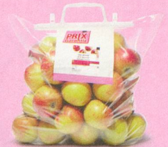
Pommes Prix Garantie, Suisse, le cabas de 2.5 kg (1 kg = 1.40) 3.50