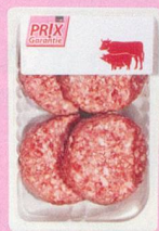
Galettes de viande hachée Prix Garantie, Suisse, en libre-service, 4 x 150 g (100 g = 1.37) 8.20