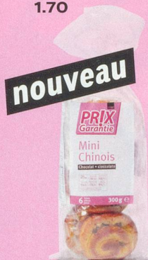
nouveau Mini-chinois au chocolat Prix Garantie, 300 g (100 g = -.93) 2.80