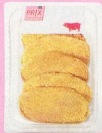
Escalopes de porc panées Prix Garantie, Suisse, en libre-service, env. 600 g 1.85 les 100 g