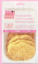
Panés de poulet Prix Garantie en libre-service, 500 g (100 g = 1.35) 6.75