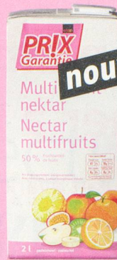
nouveau Nectar multifruits Prix Garantie, 2 litres (1 litre = -.87) 1.75