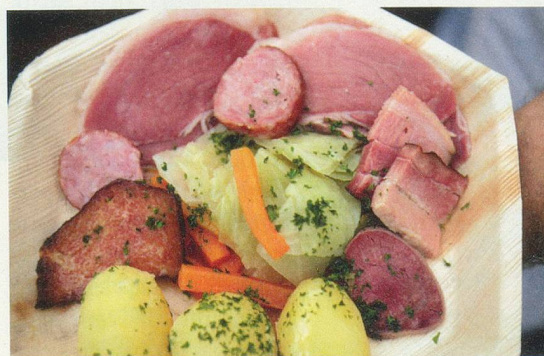
La bénichon: un menu typique, bien du terroir.