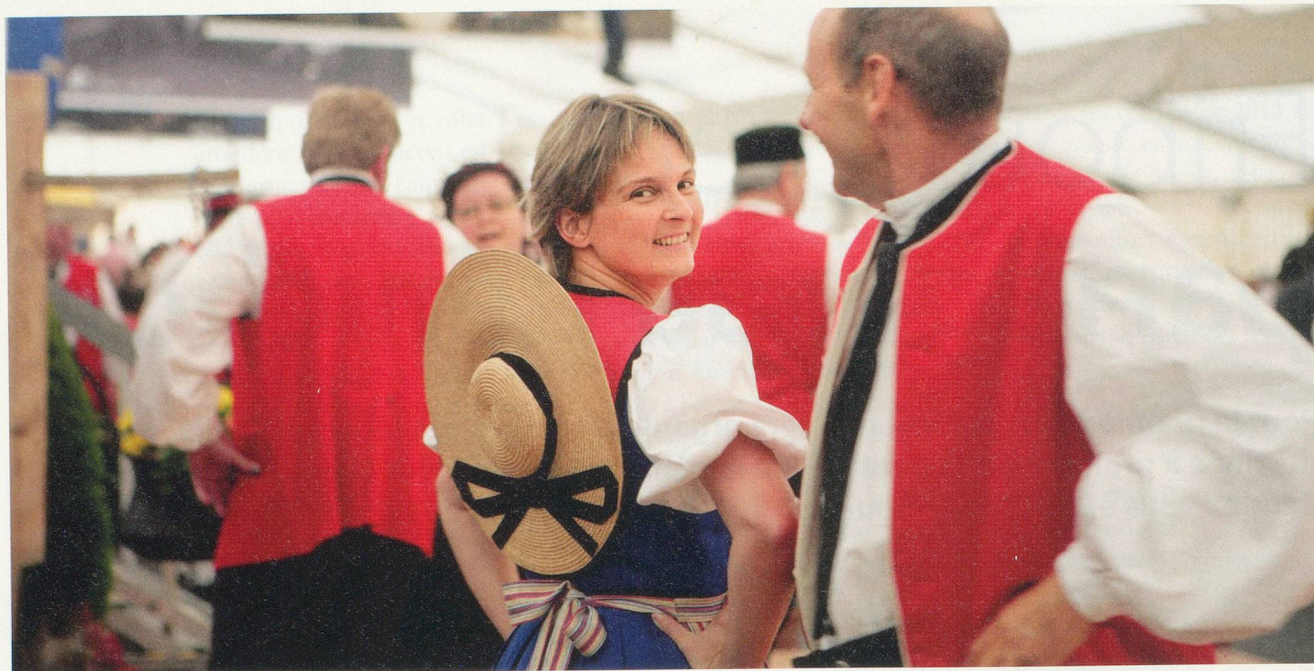
La fête de la bénichon réjouit les amateurs de bonne chère depuis longtemps déjà. Ici, les festivités à Fribourg en 2007.

servi le repas traditionnel ( Ndlr: qui coûtera une cinquantaine de francs par personne ). Il prendra place à proximité des ponts de danse, où évolueront des danseurs traditionnels au son des musiques et des chants locaux, précise Aurélie Blanc. De plus, dix restaurants partenaires de la ville proposeront un tel menu, dont le prix oscillera entre 55 et 85 francs, suivant l'établissement.»