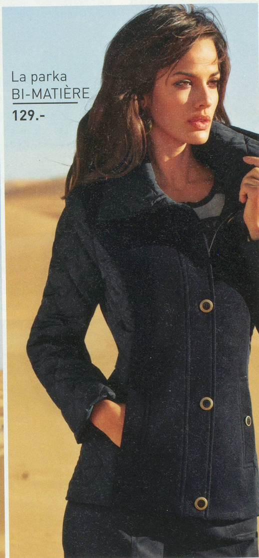
La parka BI-MATIÈRE 129.-