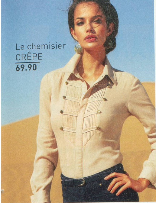
Le chemisier CRÊPE 69.90