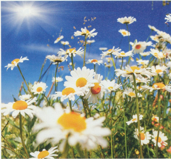
Creative Travel Projects