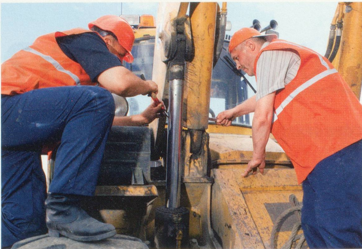
La loi devra prévoir des exceptions pour les métiers les plus pénibles.

facteurs démontrent effectivement que les seniors sont désavantagés, confirme Ewald Ackermann, porte-parole de l'Union syndicale suisse (USS). Les chiffres montrent que, les 60-65 ans – et même les 55 ans et plus – sont plus nombreux à se retrouver en fin de droits et qu'ils sont toujours sans emploi, cinq ans plus tard.» L'USS, qui prône une hausse des cotisations AVS plutôt que le report de l'âge de la retraite, combattra cette révision.