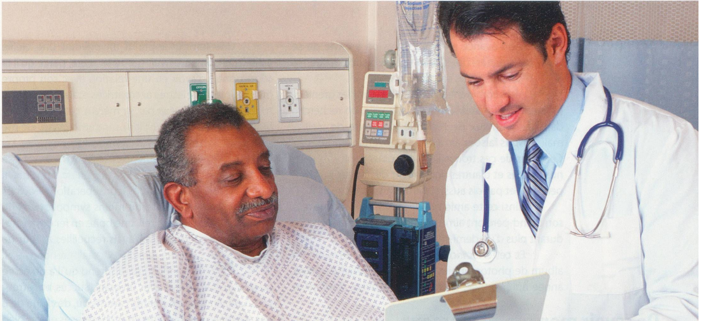
Le cancer colorectal touche 4000 nouveaux cas chaque année en Suisse.