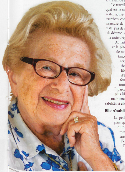
La sexologue américaine en est certaine: «Les gens doivent rester sexuellement actifs, même après 50 ans.» Pour sa part, elle travaille toujours autant aujourd'hui.