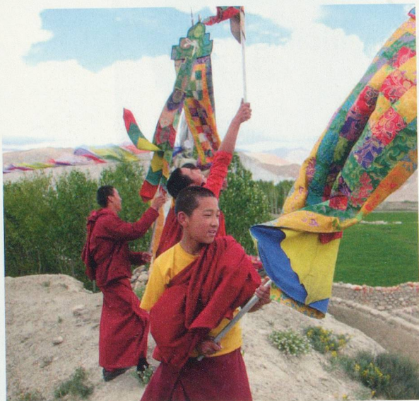
NÉPAL-MUSTANG, LES ROYAUMES PERDUS DE L'HIMALAYA de Emmanuel et Sébastien Braquet