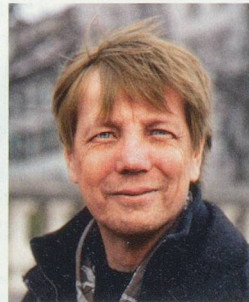
Wollodja Jentsch, photographe