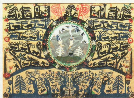
Les superbes découpages du Pays d'Enhaut méritent la plus belle des vitrines.