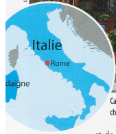
Carloforte est l'unique centre urbain de l'île San Pietro, rattachée à l'archipel des Sulcis au sud-ouest de la Sardaigne.