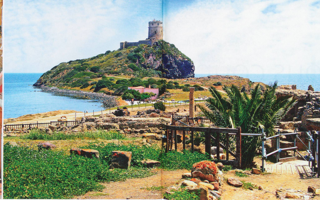
Nora est une ancienne cité pré-romaine et romaine située sur la péninsule de Capo di Pula, près de Cagliari en Sardaigne. La tradition en fait la première cité fondée sur cette île par les Phéniciens au IX e -VIII e siècle av. J.-C. La stèle de Nora est réputée être le plus ancien document écrit européen.

et de ses centres d'intérêt lors d'une excursion d'un jour. Au sein de ces panoramas exceptionnels se défient d'impressionnantes falaises, de profondes grottes et d'imposants pics. La marche est rythmée par le ressac de la mer, bercée par les subtiles fragrances du maquis: lavande, thym, myrte, etc. Un bonheur simple, mais tellement agréable! Comment résister à ces petites criques célestes de sable fin, blotties à l'abri de parois vertigineuses et dénichées qui tombent abruptement dans des flots turquoise presque irréels? Finalement, pourquoi ne pas s'y arrêter afin de faire une siesta , coutume locale, ou pour y piquer une tête? Dans tous les cas, on ne manquera sous aucun prétexte la plus exceptionnelle de toutes: Cala Goloritzé, l'une des rares plages à avoir été classée au Patrimoine mondial de l'UNESCO. C'est dire!