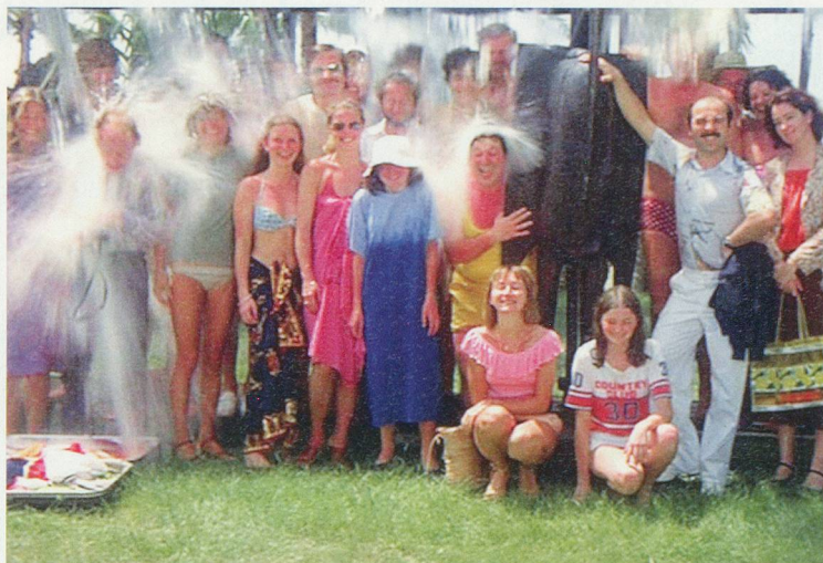
Que ce soit en Afrique ou dans les Alpes françaises, Les Bronzés a fait rire des millions de spectateurs.

DIRTY DANCING Plus joyeux, plus entraînant avec une bande-son juste incroyable et un Patrick Swayze,