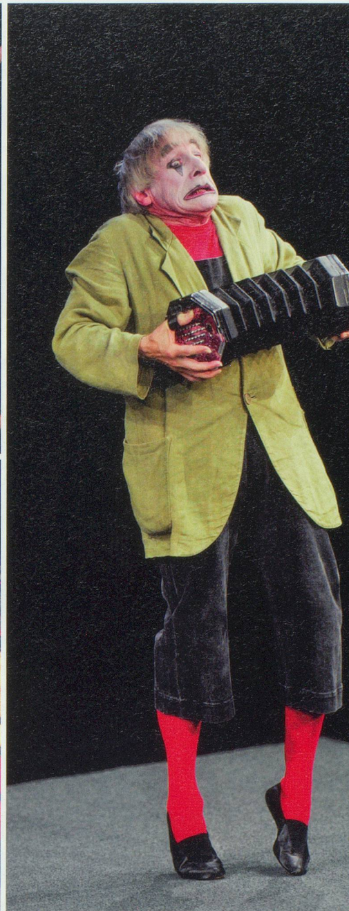
Quelques facettes d'un artiste génial qui ne voit aucune raison d'arrêter sa carrière aujourd'hui.