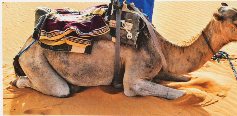
L. P. / G. P.

En suivant l'écran de verdure dessiné par le Drâa, qui ressemble presque à un mirage dans cet environnement aride,