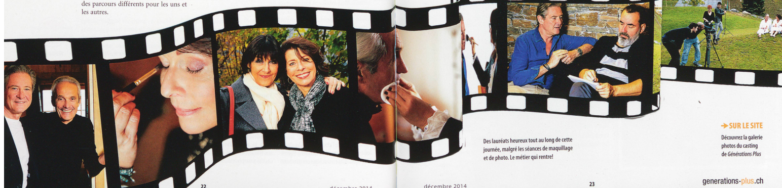
Des lauréats heureux tout au long de cette journée, malgré les séances de maquillage et de photo. Le métier qui rentre!