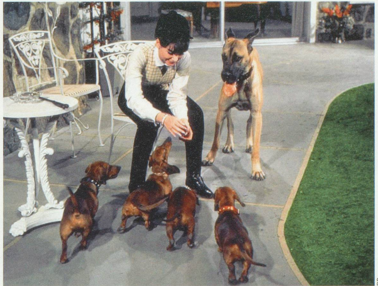
Quatre bassets pour un danois, un bon vieux Walt Disney qui fera le bonheur des petits et des grands.

Sinon, réfugiez-vous au rayon des classiques avec Les 101 dalmatiens , La belle et le clochard ou encore Chiens des neiges avec Cuba Gooding JR, dans le rôle du pauvre type vivant en Floride et qui hérite d'un attelage de chiens polaires en Alaska. Cerise sur la pâtée, un vrai classique du genre qui date de 1967: Quatre bassets pour un danois . Petit résumé: Madame s'emmourache