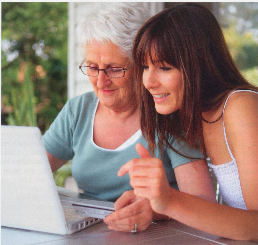
Le commerce en ligne, un succès croissant depuis de nombreuses années.

Un succès loin d'être isolé. Côté textile, Zalando, le numéro un de la vente de mode en ligne en Europe,