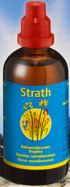
25 août