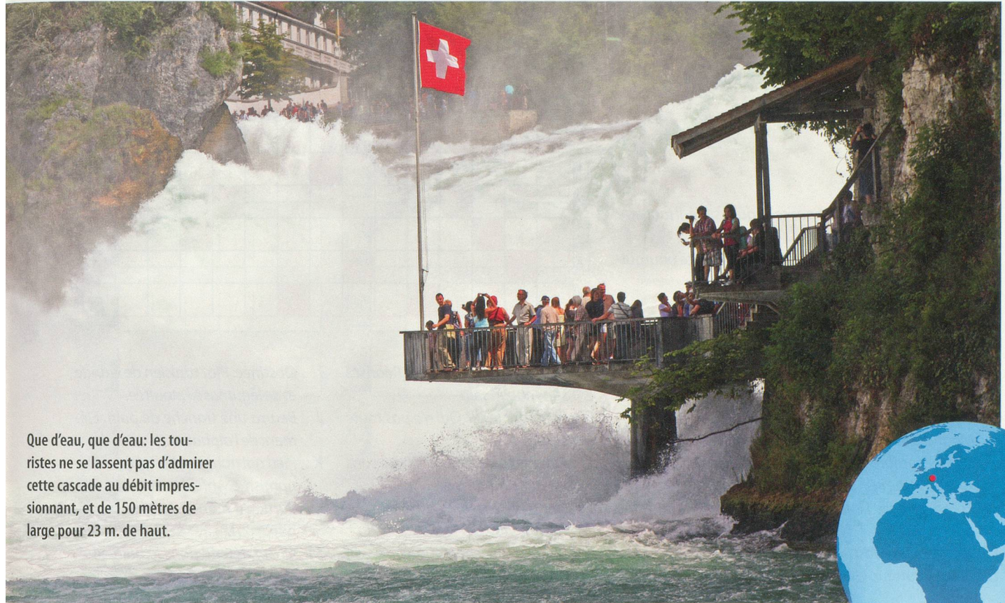
Que d'eau, que d'eau: les touristes ne se lassent pas d'admirer cette cascade au débit impressionnant, et de 150 mètres de large pour 23 m. de haut.

À Schaffhouse, les eaux de ce fleuve jouent sur les contrastes et attirent les convoitises.