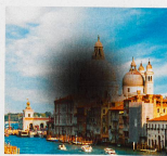
Début de DMLA