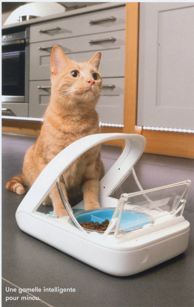
Une gamelle intelligente pour minou.