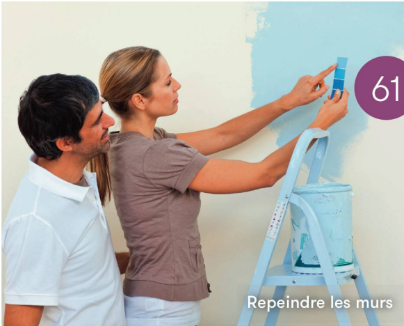
Repeindre les murs