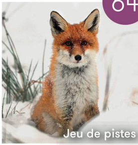
Jeu de pistes