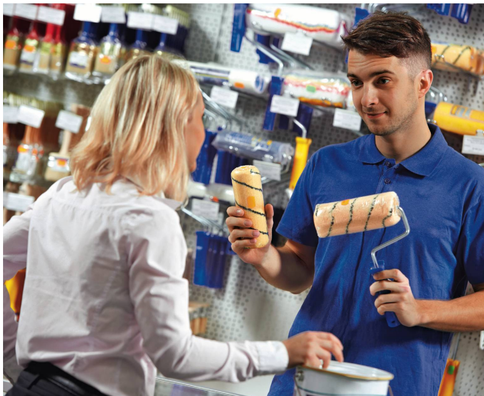
Avant de vous rendre dans un magasin, définissez les couleurs qui vous plaisent. Et attention: repeindre les murs de son chez-soi demande du savoir-faire!

vives. Mais ce n'est pas toujours le cas! Alors que choisir? Tout dépend des fonctions de chaque pièce et de l'ambiance que l'on désire y mettre. Petite visite des lieux, pour vous aider dans vos choix et vous donner un peu d'inspiration.