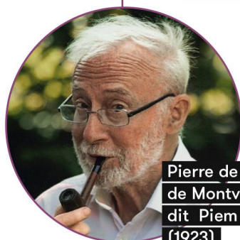
Pierre de Barrigue de Montvallon, dit Piem (1923)