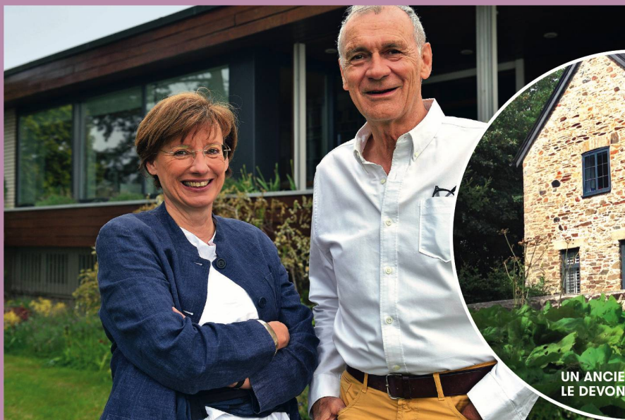
UN ANCIEN MOULIN DANS LE DEVON, ANGLETERRE