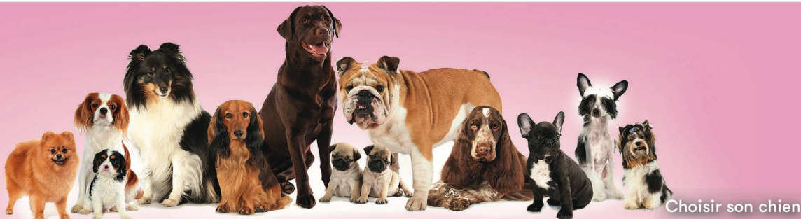
Choisir son chien