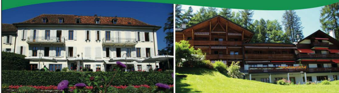
NOUVELLE ROSERAIE St-Légier (vd) 480 m CHALET FLORIMONT Gryon (vd) 1200 m

Deux Maisons de Vacances , situées dans un cadre naturel exceptionnel pour une offre de vacances personnalisée alliant confort et dynamisme.