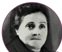
Prénom absent (décédée en 1950)