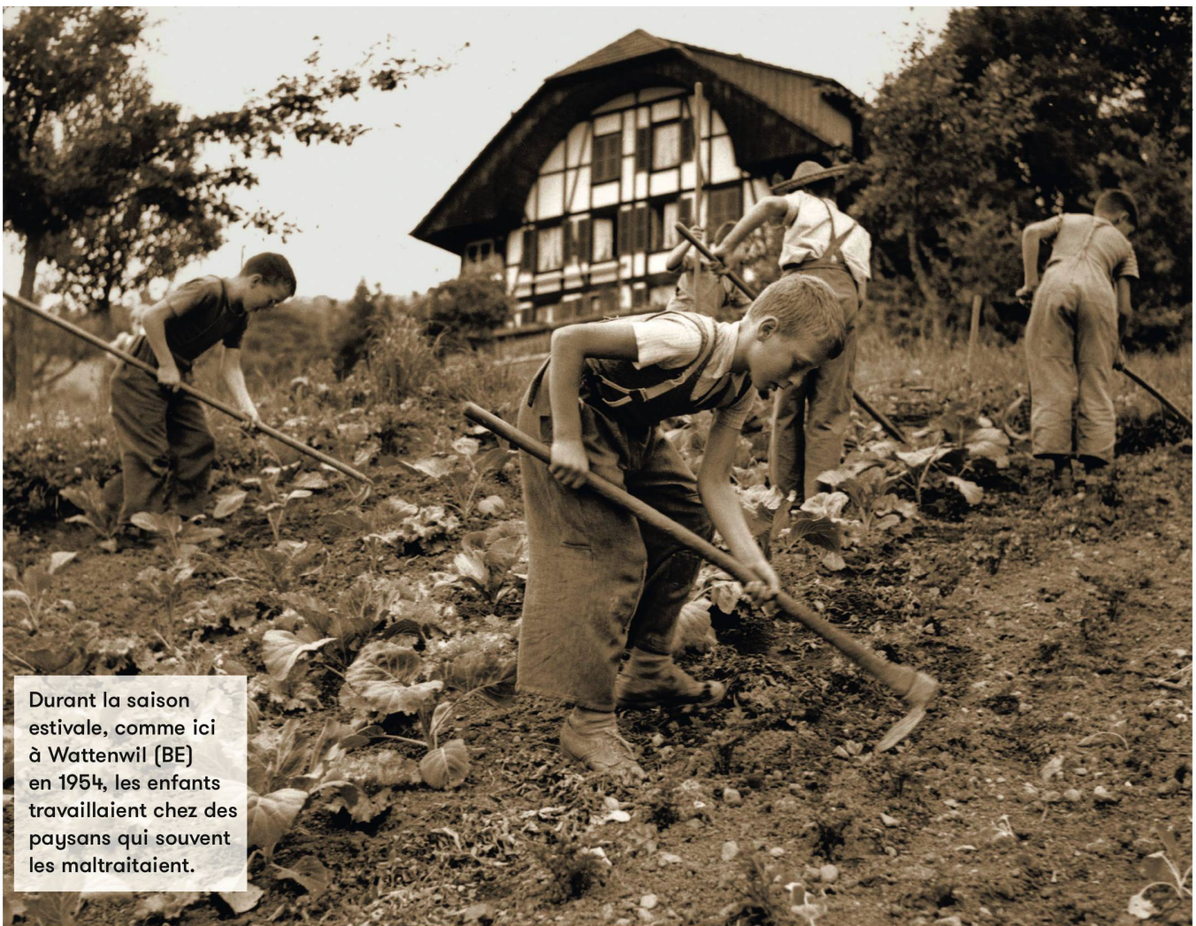
Durant la saison estivale, comme ici à Wattenwil (BE) en 1954, les enfants travaillaient chez des paysans qui souvent les maltrahaient.