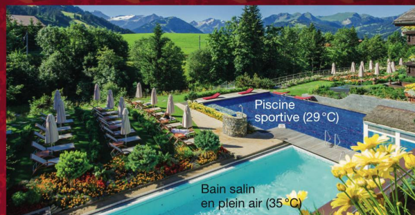
Piscine sportive (29 °C)