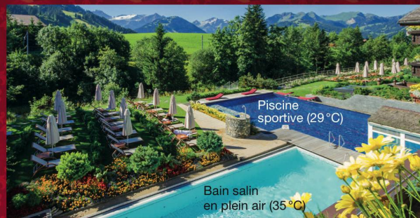
Piscine sportive (29 °C)