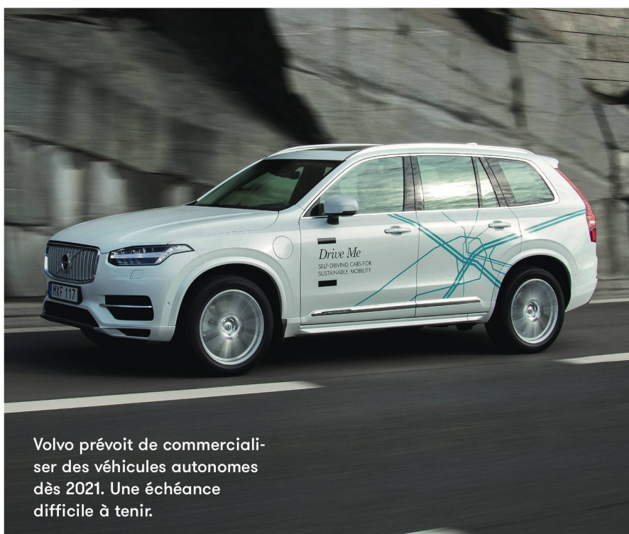
Volvo prévoit de commercialiser des véhicules autonomes dès 2021. Une échéance difficile à tenir.