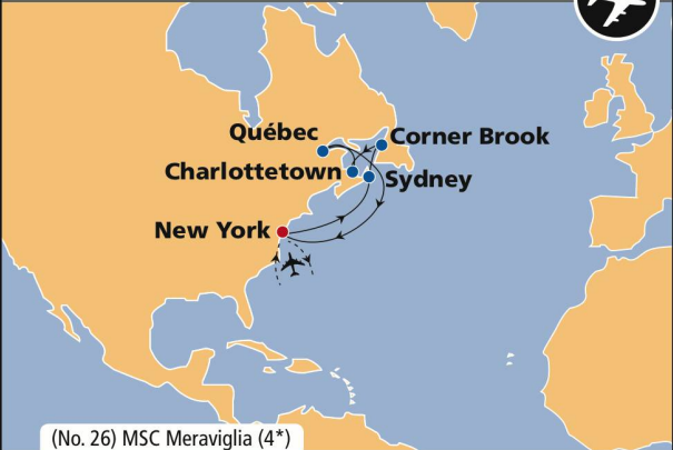
(No. 26) MSC Meraviglia (4*)