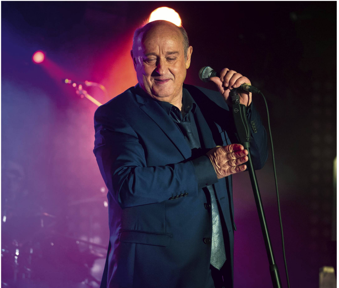
La scène est un lieu sacré pour Michel Jonasz : quelque chose en lui se met à vibrer et sa voix change.

travaille dans l'image et la réalisation.