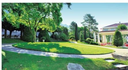
Les 3 bâtiments de l'établissement sont idéalement implantés au cœur d'un parc arborisé de 10'000 m 2 .

Un espace Snoezelen, un salon de coiffure, une salle de gymnastique et de rééducation sont à disposition de nos hôtes. Ces espaces permettent d'offrir un lieu de divertissement et relaxant tout en respectant leurs envies.