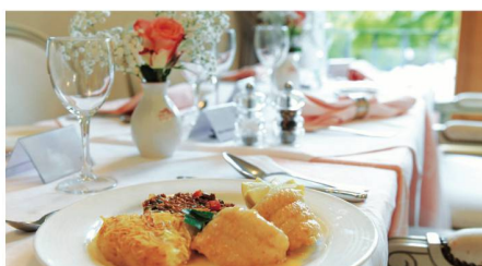
Une table et un service hôtelier de premier ordre.