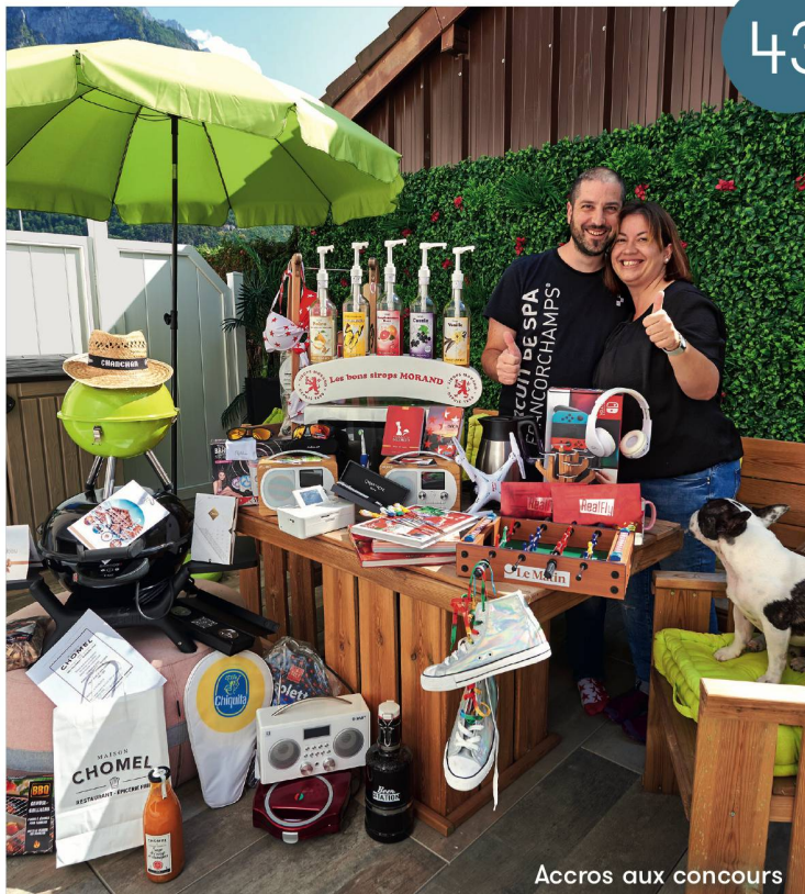
Accros aux concours