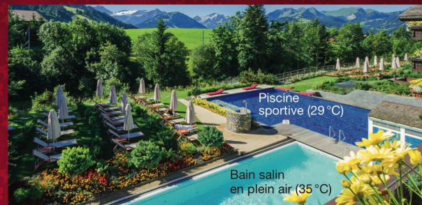
Piscine sportive (29 °C)