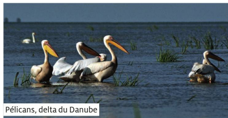
Pélicans, delta du Danube