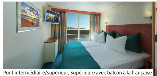
Pont intermédiaire/supérieur, Supérieure avec balcon à la française