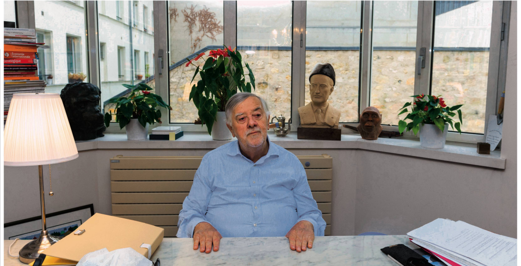
Yves Coppens, 84 ans, dans son bureau parisien. De Paris : «J'aime rendre hommage à ceux qui

Je ne suis pas angélique. Je sais que l'homme est un prédateur pour lui-même. Il l'a toujours été. Même aux temps où il y avait de la place pour tous sur la Terre, quand un groupe d'hommes