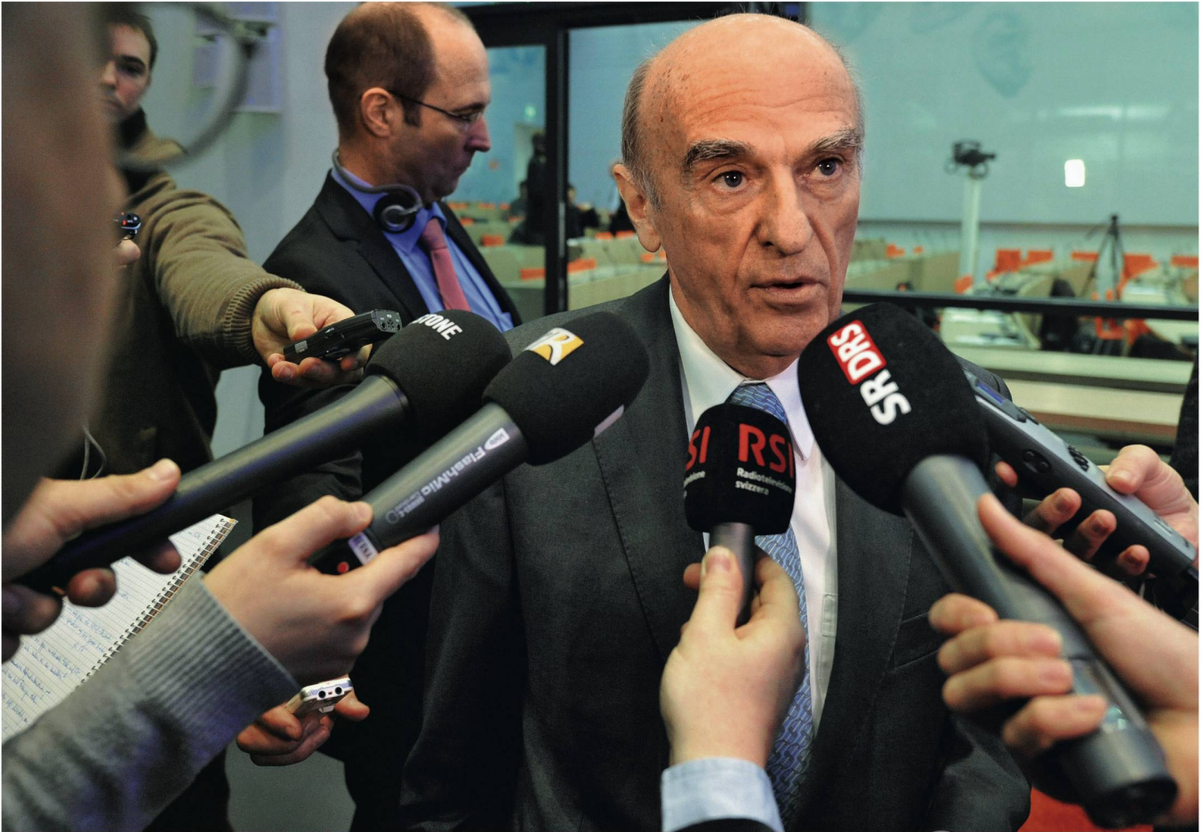
Hans-Rudolf Merz, en 2010. Deux ans avant, le conseiller fédéral fait une crise cardiaque quelques mois à peine après avoir couru le Marathon de Zurich. En pleine crise des subprimes, il avait été soumis à un stress intense.

la télévision voient leur fréquence cardiaque augmenter de 75 %.